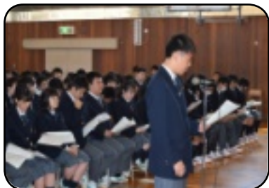
会の前に認証式が行われました。